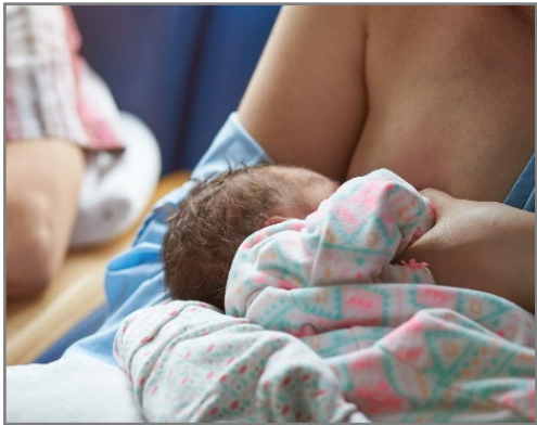
sa gatas ng ina.

Oo! Ang mga eksperto, kabilang ang CDC, ang American College of Obstetricians at Gynecologist, ang Society for Maternal-Fetal Medicine, at ang American College ng Nurse-Midwives ay nagrerekomenda na mabakunahan laban sa COVID-19 ang mga taong nagpapasuso.