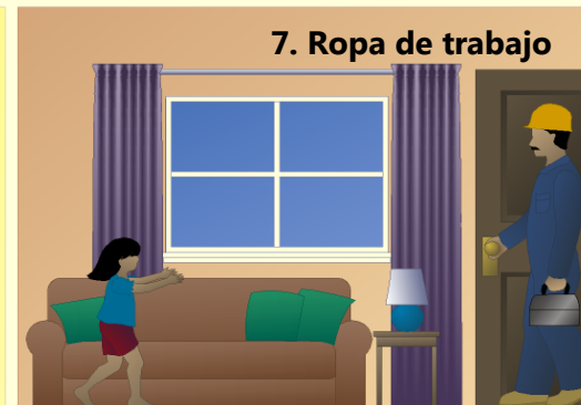
7. Ropa de trabajo

Haga que su hogar sea seguro para el plomo y saludable para los niños