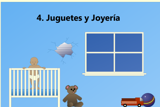
4. Juguetes y Joyería