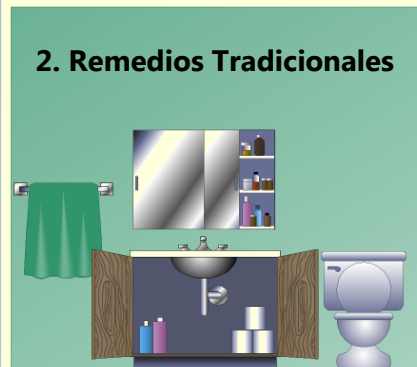
2. Remedios Tradicionales