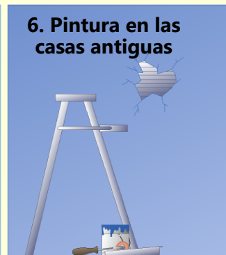
6. Pintura en las casas antiguas